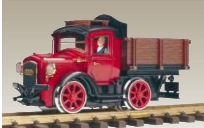
20680 Aha® Pritschenwagen